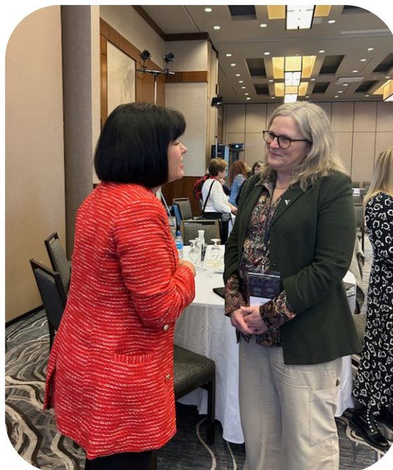
Forum des vétérans à Montréal avec la Ministre Ginette Petitpas-Taylor