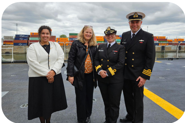
Visite du brise-glace NCSM William Hall