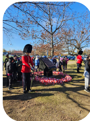
Commémorations au Collège John-Abbott