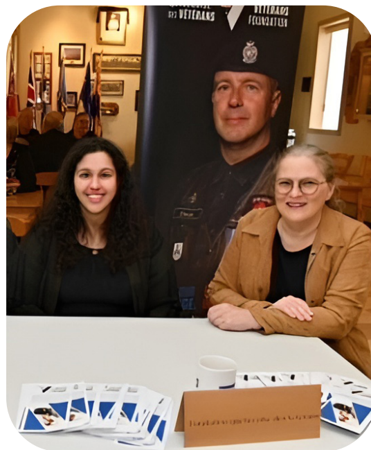
Salon des vétérans