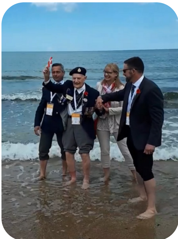
80e du débarquement de Normandie