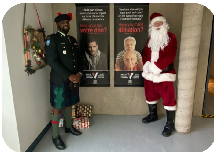
Visite du Black Watch à Noël